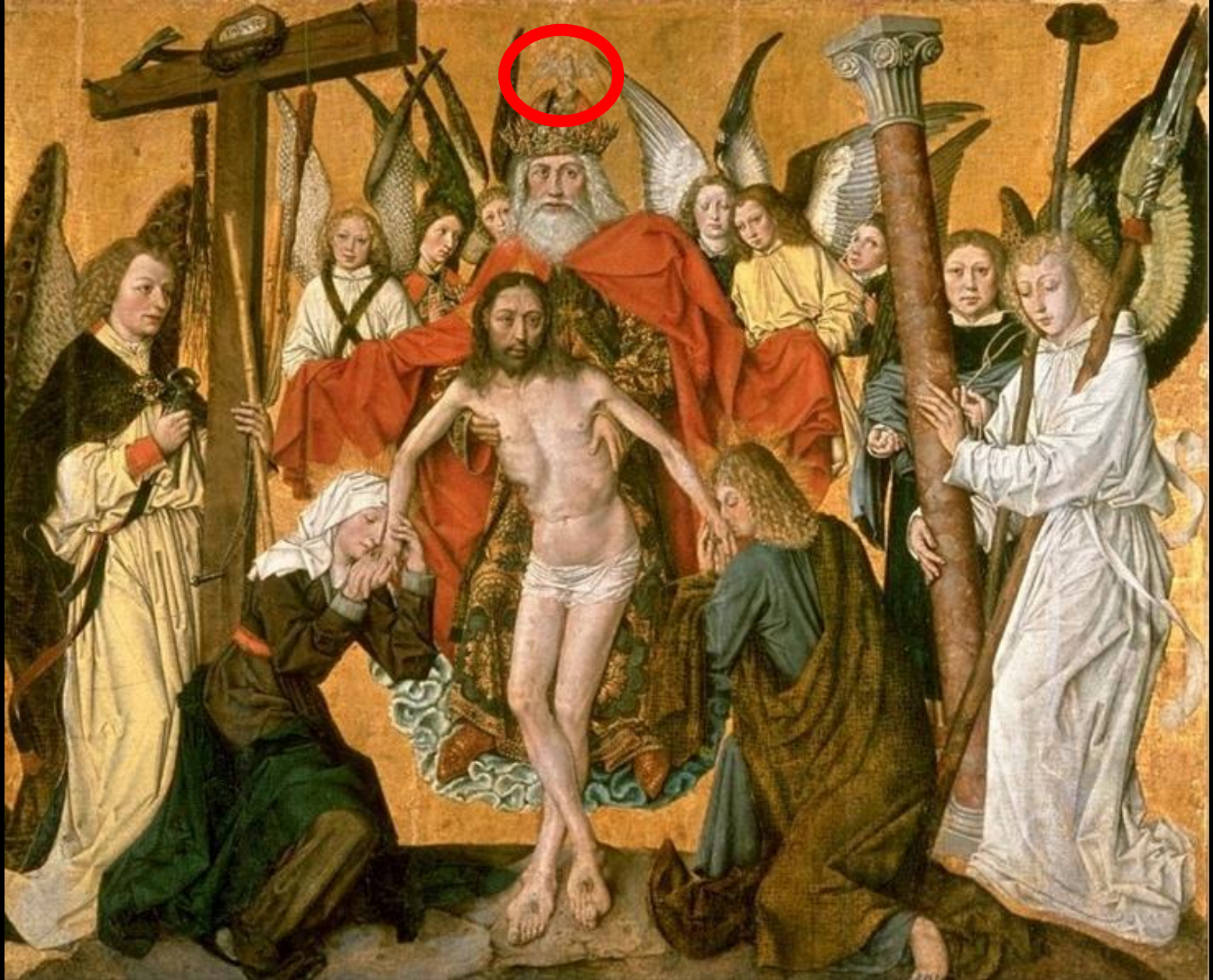
Gemälde „Die Heilige Dreieinigkeit als Gnadenstuhl“ aus dem Salzburgischen (1470)